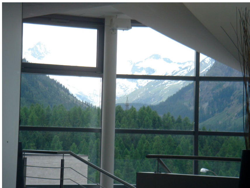
Fig. 1 – Local da reunião